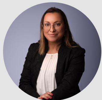
DIRECTRICE GÉNÉRALE & DIRECTRICE ADMINISTRATIVE