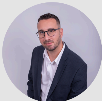
PRÉSIDENT & FORMATEUR

Conformément à la réforme de la formation professionnelle APERIA SOLUTIONS est certifié. A ce titre, les actions de formation conduite par APERIA SOLUTIONS peuvent faire l'objet de financement de la part des OPCO (Opérateur de compétence) ainsi que par les financeurs Public